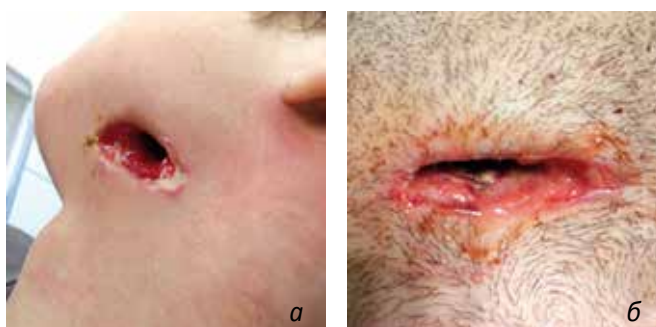
Рис. 4 Состояние гнойных ран в результате применения дренажных устройств, изготовленных из сорбционного материала «ВитаВаллис» (4-е сутки наблюдения).