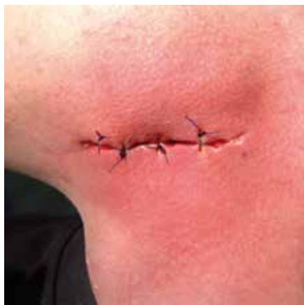
Рис. 5 Состояние раны после наложения наводящих швов (5-е сутки наблюдения).

свидетельствовать об активном очищении раны сорбционным материалом. Показательно, что на этом сроке только в опытной группе в цитологическом мазке отмечались единичные фибробласты и полибласты, а также лимфоциты – 1,9% против 0% в контроле, что демонстрирует начало репаративных процессов с участием иммунной системы.