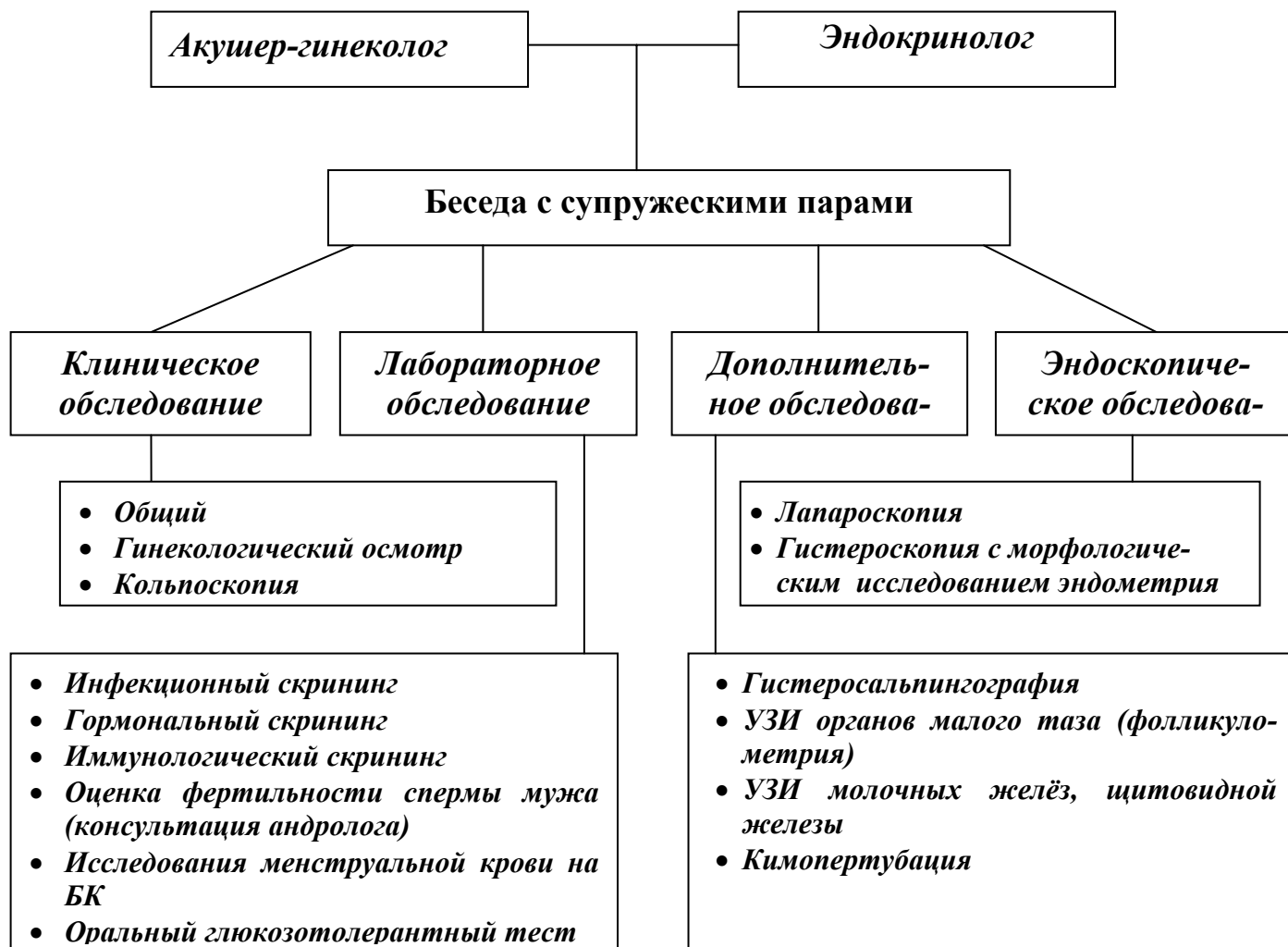
Рис. 1. Алгоритм обследования супружеских пар с бесплодием

В процессе исследования больных был разработан следующий алгоритм обследования супружеских пар с бесплодием (рис. 1).