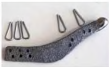
Рис. 6 Готовый эндопротез из никелида титана с фиксирующими элементами