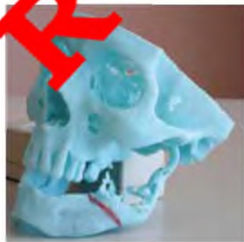
Рис. 2 Линия резекции на границе опухоли и здорового участка кости нижней челюсти