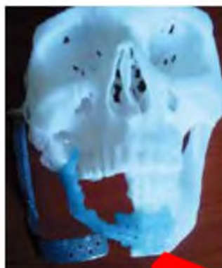
Рис. 10, 11 Стереолитографическая модель нижней челюсти