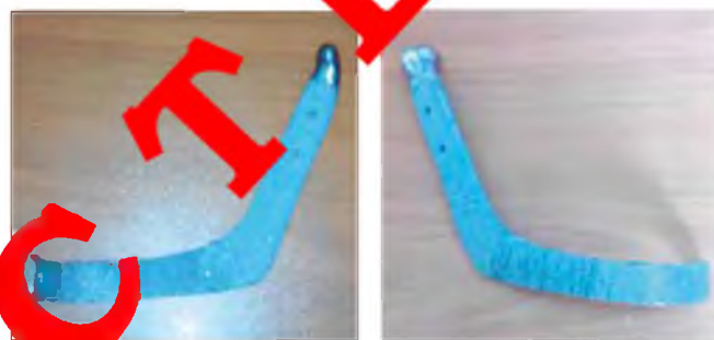
Рис. 12,13 Индивидуальный эндопротез нижней челюсти из никелида титана

плану, под общим обезболиванием, произведено удаление опухоли вместе с проволочной конструкцией. Одновременным устранением дефекта эндопротезом послеоперационный период протекал нормально, заживление раны первичным натяжением, швы удалены на 8 сутки. В результате проведённой операции контуры и функции нижней челюсти восстановлены в полном объёме, что подтверждено и рентгенологически (рис. 14). При осмотре через год – состояние больного удовлетворительное, функциональных нарушений со стороны зубочелюстного аппарата не выявлено, состояние эндопротеза удовлетворительное (Рис. 15-16).