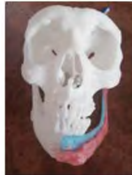
Рис. 5 Моделирование восковой композиции эндопротеза