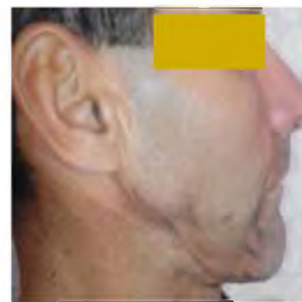
Рис. 15, 16 Фото пациента через 12 месяцев после оперативного вмешательства