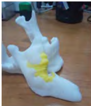
Рис. 1 Специальные методы окрашивания опухолевидного образования на стереолитографической модели

для эндопротеза (рис. 3); точек для формирования фрезевых отверстий для фиксации эндопротеза к здоровому фрагменту нижней челюсти (рис. 4); моделирование восковой композиции конструкции будущего эндопротеза с учётом индивидуальных особенностей и анатомического строения заменяемого отдела нижней челюсти (рис. 5).