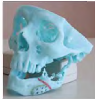
Рис. 4 Нанесение точек для формирования фрезевых отверстий (отмечены чёрными точками)