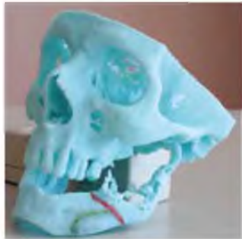
Рис. 3 Нанесение ориентиров участка декортикации по формированию ложа для эндопротеза (отмечены зеленым цветом)